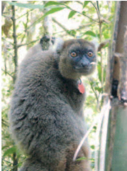
Großer Bambuslemur ( Prolemur simus ) im Nationalpark von Ranomafana.

Auch der Große Bambuslemur ( Prolemur simus ) wird nach den IUCN-Rote-Liste-Kriterien als kritisch bedroht eingestuft (MITTERMEIER et al. 2006) und galt bis zu seiner Wiederentdeckung 1960 schon als ausgestorben. Fossilfunde belegen eine frühere Verbreitung dieser Art fast über die ganze Insel, heute kommt sie nur noch im Regenwaldgebiet im Osten Madagaskars mit einer Konzentration auf die Nationalparks von Ranomafana und Andringitra vor. Bestandsschätzungen für die Region von Ranomafana, wo auch unsere Datensammlung erfolgte, sprechen von maximal 250 Tieren. Neuere Berichte aus dem Gebiet implizieren jedoch, dass diese Zahl den tatsächlichen Be-