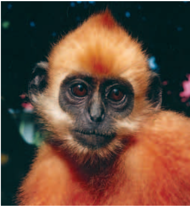
Goldkopf-Langur ( Trachypithecus poliocephalus ).