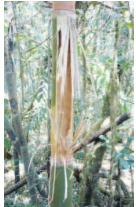
Ausgehöhlter Bambusstamm des Cathariostachys madagascariensis .

Bisherige Auswertungen der Daten zur Lebensraumbeschreibung zeigen, dass sich in Ambatolahy dimy wahrscheinlich weniger Bambus als in Talatakely befindet. Da bei den Großen Bambuslemuren als Nahrungsspezialisten eine extreme Abhängigkeit zur Nahrung besteht, könnte hierin ein Grund für das zunehmende Verschwinden in diesem Gebiet bestehen. Außerdem übt der Mensch in Ambatolahy dimy, einem ungeschützten Gebiet, z. B. durch Bambusschlag zum Hausbau großen Einfluss aus. Menschlicher Einfluss in Talatakely erfolgt durch Touristen, von denen durchschnittlich 55 pro Tag gezählt wurden. Auch diese können für die Tiere einen Störfaktor darstellen.